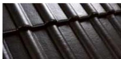
Czarny M200 80