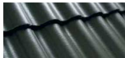
Oliwkowozielony 0200 83