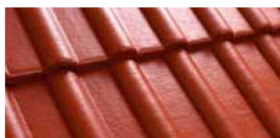
Terakota M200 86