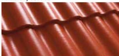
Terakota 0200 86