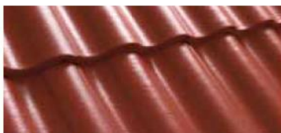
Kasztanowy 0200 82