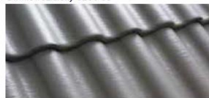
Szary 0200 88